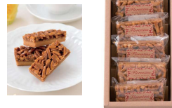
・フロランタン×5個