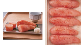
・大吟醸仕込辛子めんたいこ270g