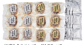
・松坂牛入りハンバーグ120g×6 ・黒毛和牛入りハンバーグ100g×6 ・ハンバーグソース20g×12