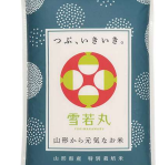
・特栽培培米雪若丸5kg×5