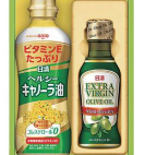
・日清ヘルシーキャノーラ油350g×1本・日清エキストラバージンオリーブオイル145g×1本