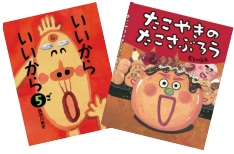
2冊セット ※写真の絵本とは限りません。