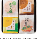
・しみかりせん(醤油・柚子)×各8袋 ・さがえ焼×7枚 ・野菜カレー煎餅5枚