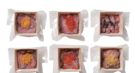
・若狭牛ローストビーフ(うに、いくら、ずわいがに)各50g×2・若狭牛ローストビーフ(黒トリュフ)45g×2