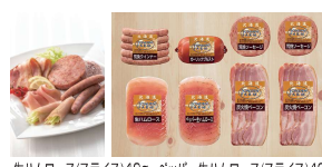
・生ハムロース(スライス)40g・ベーター生ハムロース(スライス)40g ・あらびきソーセージ70g×2・あらびきウィンナー100g ・ガーリックブルスト200g・炭火焼ベーコン(スライス)80g×2