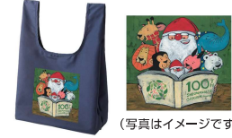
(写真はイメージです) 谷口智則先生×四條畷学園コラボ サイズ:360(持ち手含む550)×300×180(横マチ)mm