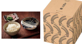
・包装米飯(白飯)160g×5(うるち米)