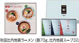
・秋田比内地鶏ラーメン(麺70g、比内地鶏スープ32g) ・横浜豚骨醤油ラーメン(麺70g、豚骨醤油スープ37g) ・尾道中華そば(麺70g、中華そばスープ36g) ・ラーメン用具材(ハートなると、小ねぎ、白煎りごま)×3袋

A-5 <UMAMI>ご当地ラーメン D 1万円 【秋田比内地鶏・横浜豚骨醤油・尾道中華そば】