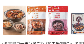
・名古屋コーチンおこわ(加工米350g、名古屋コーチン入だし汁300g)×5・大納言お赤飯(加工米350g、小豆煮汁250g、小豆30g、ごま塩1.6g)×5・味噌おこわ290g×5