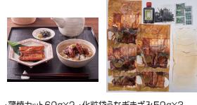
・蒲焼カット60g×2・化粧袋うなぎざきみ50g×3 ・吸い地(ダン)120g×3・山椒2袋 ・おろしわさび3袋・きざみおろし3袋・ポルトだれ50ml