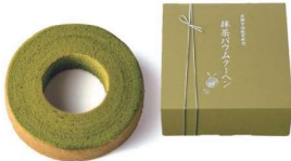
・抹茶baumクーヘン1個(直径約13cm)