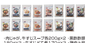
・肉じゃが、牛すじスープ各200g×2・黒酢豚豚180g×2・牛すじと煮170g×3・鶏肉と茄子のピリ辛炒め150g×2・ピリ辛筑前煮130g×2・さばの煮付け100g×2