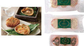
・かに甲羅グラタン(3個入)270g・かにみそ甲羅焼(3個入)90g・かに甲羅揚げ(3個入)360g