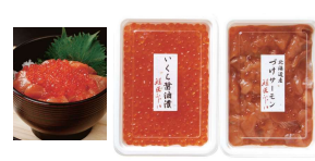
・いくら醤油漬120g×2 ・つけサーモン120g×3