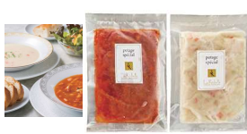
・ミネストローネ150g×6 ・クリームスープ150g×6