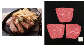
・モモステーキ(3枚)計240g