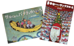
2冊セット ※写真の絵本とは限りません。