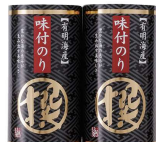
・味付のり8切12枚×2袋(板のり3枚分)×2

A-5 <UMAMI>ご当地ラーメン D 1万円 【秋田比内地鶏・横浜豚骨醤油・尾道中華そば】