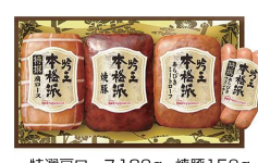
・特選肩ロース180g・焼豚150g ・あらびきミートローフ150g ・特選あらびきウィンナー70g