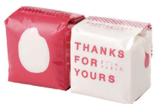
・新潟県南魚沼産コシヒカリ300g(2合)×2