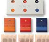
・かつおだし6g×3袋・あごだし6g×3袋 ・鰯だし5.2g×3袋