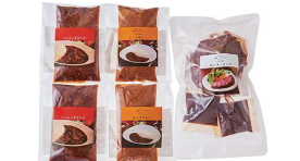
・ローストビーフ300g・デミグラスソース30g×2 ・ビーフカレー200g×2・ハッシュドビーフ200g×2