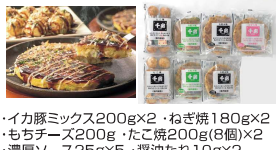
・イカ豚ミックス200g×2・ねぎ焼180g×2 ・もちチーズ200g・たこ焼200g(8個)×2 ・濃厚ソース25g×5・醤油たれ10g×2 ・かつお節1g×7・ホワイトソース10g×7 ・あおさのD、2g×7