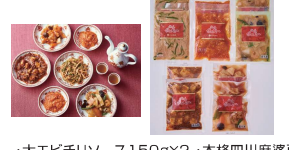
・大エビチリソース150g×2・本格四川麻婆豆腐150g×2・豚豚150g×2・本格八宝菜150g×2・青椒肉絲150g×2