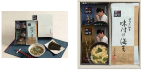
・ふんわりたまごスープ6.4g ・お揚げと小松菜スープ3.6g ・味付け海苔8切5枚