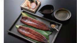
・うなぎ長蒲焼120g×5、特製たれ10ml×5、山椒0.2g×5 / うなぎ:静岡県産