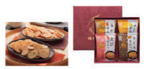
・えびせんべい・コーンせんべい・ソースせんべい・カレーせんべい各15g ●うるち米: 国産

A-4 〈UMAMI〉ご当地ラーメン 1万円 【函館塩・東京煮干・和歌山豚骨醤油】