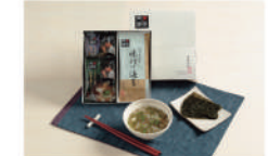
・ふんわりたまごスープ6.4g、お揚げと小松菜スープ3.6g、味付け海苔8切5枚