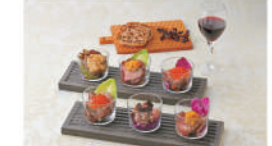
・若狭牛ローストビーフ(うに、いくら、すまいがに)各50g×2・若狭牛ローストビーフ(黒トリュフ)45g×2