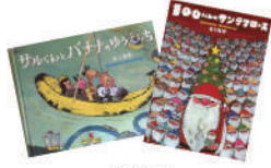
2冊セット ※写真の絵本とは限りません。