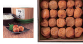
・はちみつ梅(塩分約7%)930g / 梅:和歌山県産