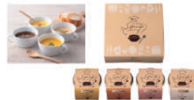
・北海道産チーズコン16.5g、北海道産かぼちゃ16.5g、北海道産サーモンクリーム17.2g、北海道産オニオン7g