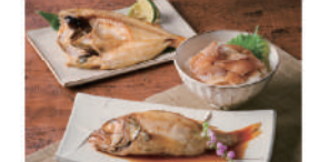
・のどぐる開き・のどぐる煮付×各5尾、のどぐる煮付揚げ80g×5 / 開せと煮付のどぐる(赤むつ):日本・韓国産、煮付のどぐる(赤むつ)