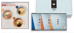
函館塩ラーメン(麺70g、塩スープ44g)、東京煮干醤油ラーメン(麺70g、煮干醤油スープ33g)、和歌山豚骨醤油ラーメン(麺70g、豚骨醤油スープ37g)、ラーメン用具材(ハートなると、小なま、白胡のこ)×3袋

A-4 〈UMAMI〉ご当地ラーメン 1万円 【函館塩・東京煮干・和歌山豚骨醤油】