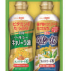
・ヘルシーキャノーラ油・ヘルシーオフ各350g