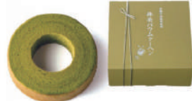
・抹茶バウムクーヘン1個 (直径約13cm)