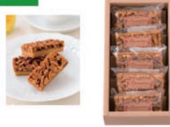
・フロランタン×5個