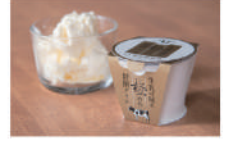
・生乳の味を極めた特撰アイス110ml×14個