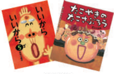
2冊セット ※写真の絵本とは限りません。