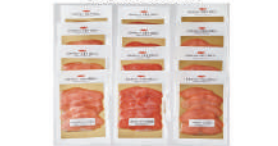
・紅鮭スモーク・野鮭スモーク・秋鮭スモーク各40g×4