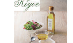
・100%オイル455g×4 オーストラリア製